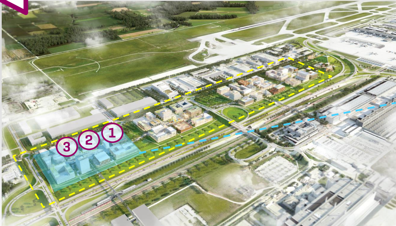
AirSite West, Lab Campus